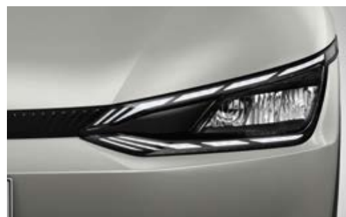
פנסים ראשיים MFR LED (בדגם Premium)