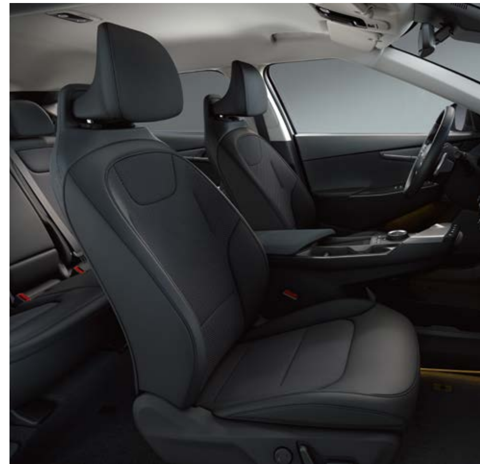
Premium מושבים המשלבים בד ועור טבעוני (סטנדרט)