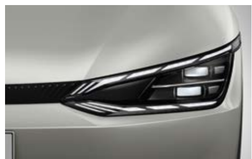
פנסים ראשיים IFS LED (בדגם GT-Line)