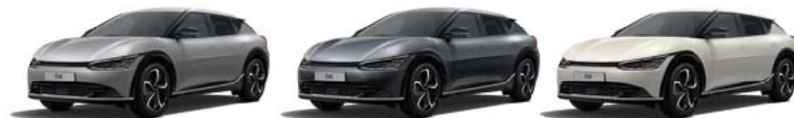
Steel Gray (KLG)*