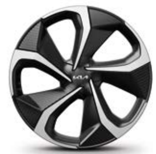
חישוקי סגסוגת 20 אינץ' (GT-line)