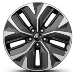
חישוקי סגסוגת 19 אינץ' (Premium)