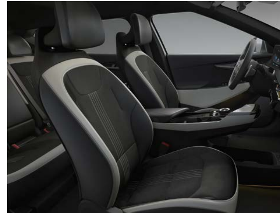
GT-line זמש שחור עם כריות צד מעור טבעוני (סטנדרט)

החל מזמש רך ועמיד וכלה בעור טבעוני וחומרים ממוחזרים: ה-EV6 מעוצבת בצורה ארגונומית לנוחות הגוף שלך ולשקט הנפשי שלך. ידידותית לסביבה ובת קיימא. זה לא רק עניין של סגנון. זו דרך חדשה להיות.