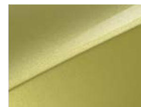
Splash lemon (G2Y)