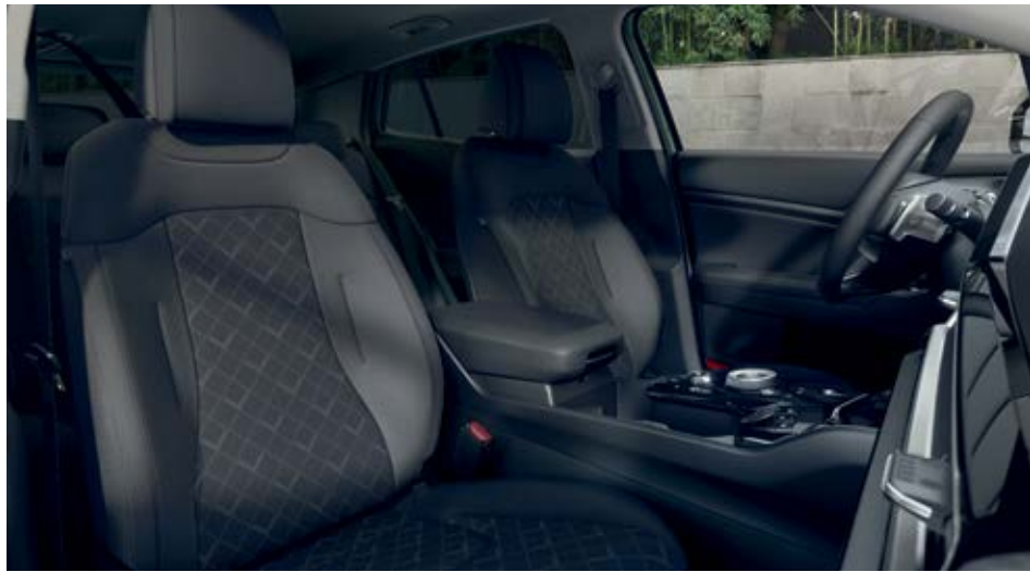
TOP+URBAN – בד שחור סטנדרטי. רמת הגימור LX מגיעה כסטנדרט עם מושבים וכריות צד מצופים בבד שחור עם תפרים שחורים, וריפוד תקרה אפור.