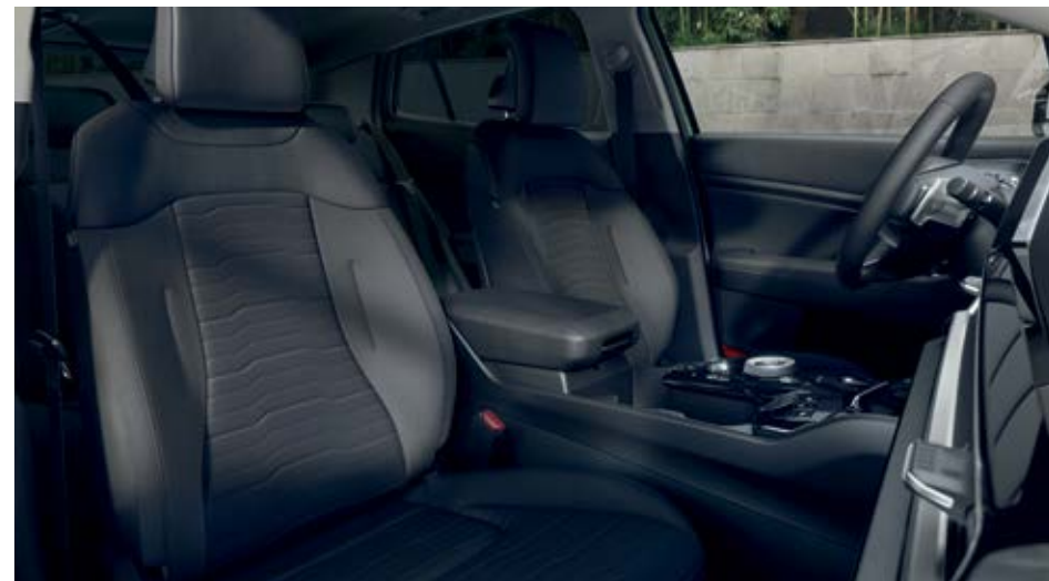
EX – בד שחור ועור מלאכותי. המושבים וכריות צד המצופים בבד שחור ועור מלאכותי מתאפיינים בתפרים שחורים לשרוג המראה. החיפויים העליונים בדלתות הם רכים למגע, משענות היד בדלתות מצופות בעור מלאכותי, לוחות החיפוי המרכזיים בדלתות מצופים בעור מלאכותי (אופציה) וריפוד התקרה הוא אפור.