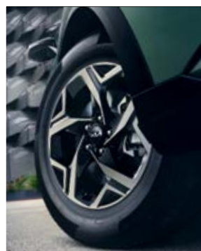
חישוקי סגסוגת 17 אינץ'