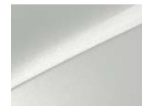
Tricoat White Pearl (HW2)