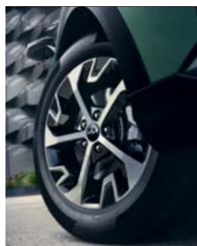
חישוקי סגסוגת 18 אינץ'