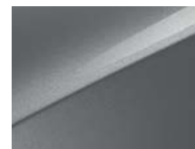
Sparkling silver (KCS)