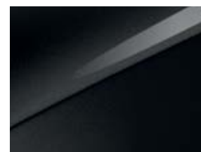
Pearl black (1K)

כל אחת מהגרסאות של קיה ספורטאז' החדש מעוצבת עד הפרט האחרון. וזה כולל חישוקים אלגנטיים, ספורטיביים ומרשימים באמת. בחרו בין חישוקי 17 אינץ' לחישוקי 18 או 19 אינץ' מלוטשים.