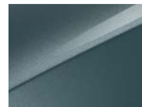
Yuka steel gray (USG)