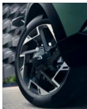
חישוקי סגסוגת 19 אינץ'