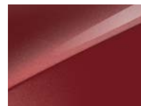
New infra red (AA9)