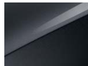
Dark gray (H8G)