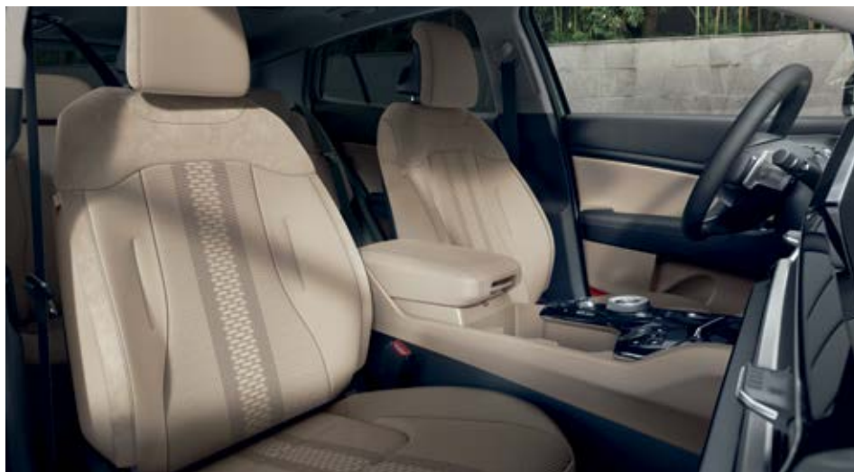
PREMIUM – עור אייס קפה. מושבי עור בצבע קפה מיוחד מוסיפים מגע של סגנון. כולל גם דגשי זמש בחלק העליון של המושבים ובצידי משענות הראש. להשלמת החבילה, החיפויים העליונים בדלתות הם רכים למגע ולוחות החיפוי המרכזיים ומשענות היד בדלתות מצופים בעור מלאכותי בצבע קפה. מגיע עם ריפוד תקרה אפור.