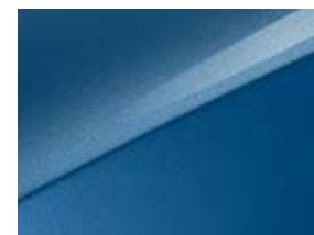
Lapis pyrment (B3L)