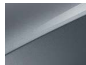
Cool silver (CSS)