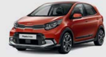
Pop Orange (G7A)