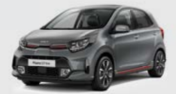
Grey (M7G) + red accent