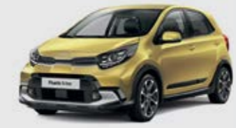
Honey Bee (B2Y)