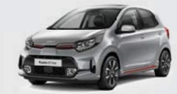
Sparkling Silver (KCS) + red accent