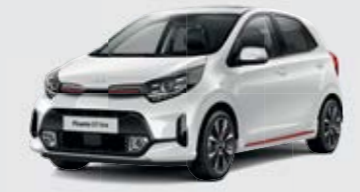
Clear White (UD) + red accent