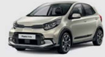
Milky Beige (M9Y)