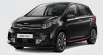
Aurora Black Pearl (ABP) + red accent