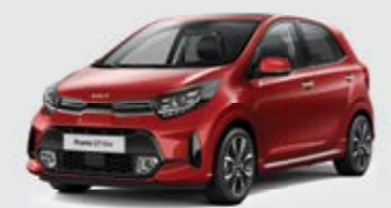
Shiny Red (A2R) + silver accent