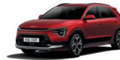
Runway Red (CR5)