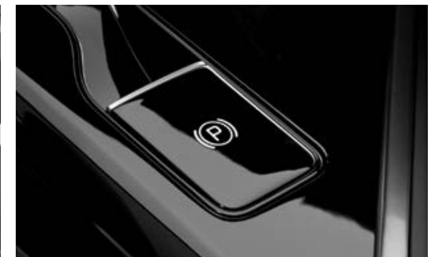
בלם חנייה אלקטרוני (EPB)