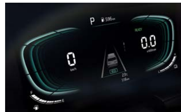
לוח מחוונים Supervision (צג 4.2 אינץ') בדגם פלאג אין