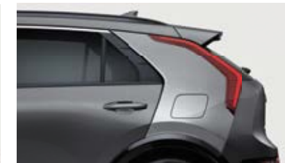
Gray With Light Gray Pillar