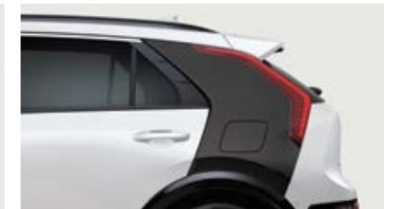
Snow White Pearl with Gray Pillar