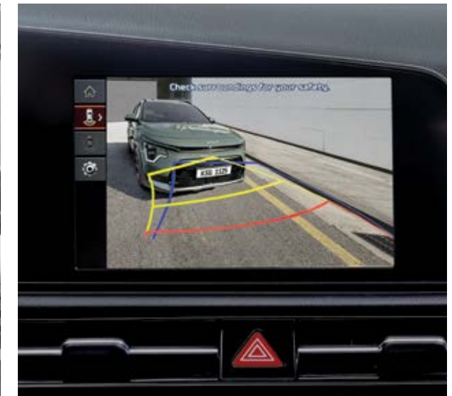
צג מבט לאחור (RVM)

סיוע במניעת התנגשות עם תנועה חוצה מאחור (RCCA) אם קיימת סכנה של התנגשות עם רכב שמגיע מימין או משמאל בעת נסיעה לאחור, מערכת RCCA מעניקה אזהרה. לאחר האזהרה, אם סכנת ההתנגשות גוברת, היא מסייעת באופן אוטומטי באמצעות בלימת חירום