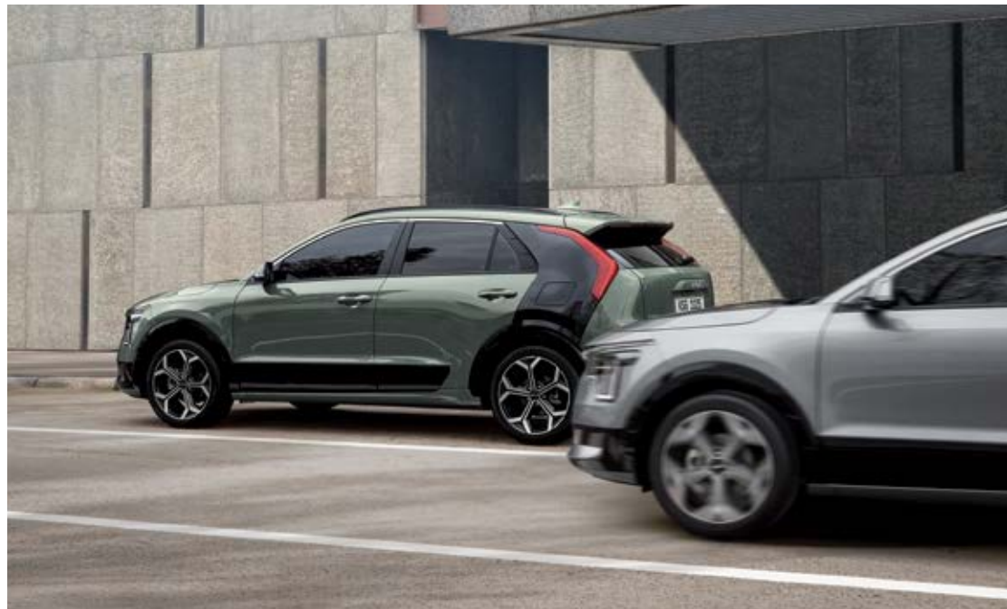
סיוע ליציאה בטוחה מהרכב (SEA)

טכנולוגיית ADAS מציעה זוג עיניים נוסף שמסייע לך בכל מצב. כשאתה נמצא בתנועה, כשאתה מחנה את הרכב, כשאתה נוסע לאחור, ואפילו כשאתה יוצא מהרכב. תרגיש מוגן.