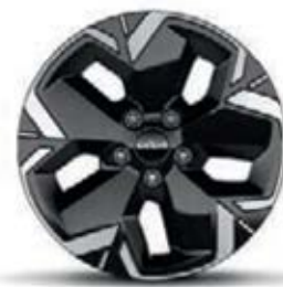
חישוקי סגסוגת 17 אינץ' *בדגם חשמלי