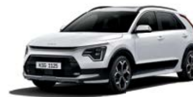
Clear White (UD)