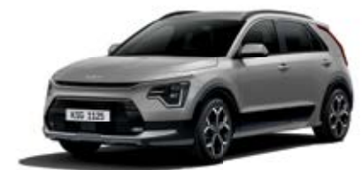
Steel Gray (KLG)