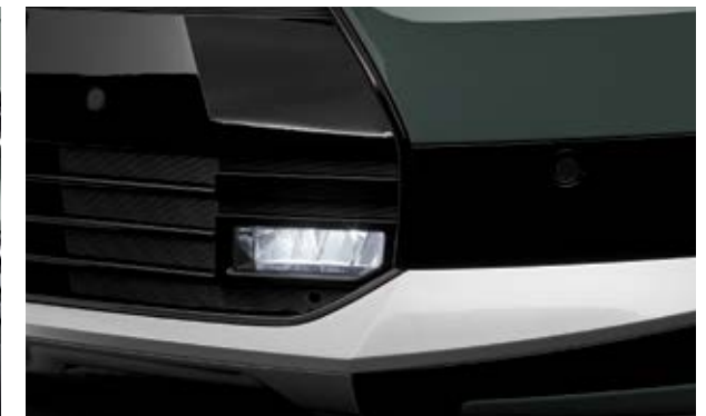
פנסי ערפל LED