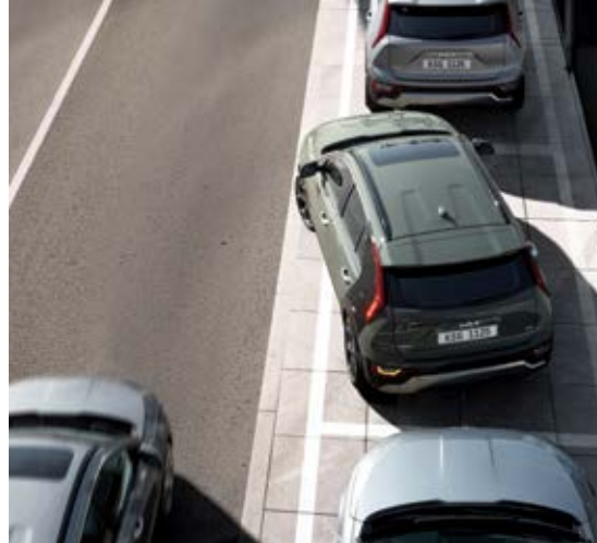
מערכת לסיוע במניעת התנגשות בשטח מת (BCA) כשאתה מפעיל את מהבהבי הפנייה כדי לעבור נתיב, מערכת BCA מזהירה אותך אם קיימת סכנה של התנגשות עם רכב שמגיע מאחור. אם בעת יציאה מחניה במקביל קיימת סכנה של התנגשות עם רכב שנמצא מאחור, היא מסייעת באופן אוטומטי באמצעות בלימת חירום.

צפייה, חישה והתערבות בכל פעם שאתה זקוק לסיוע: מערכת DRIVE WISE של קיה מיישמת את הטכנולוגיות המתקדמות ביותר בתחום מערכות סיוע מתקדמות לנהג (ADAS) כדי לעזור לך לשמור על ערנות, בטיחות ושליטה. היא מבטיחה בטיחות אולטימטיבית ליושבי הרכב ולהולכי הרגל.