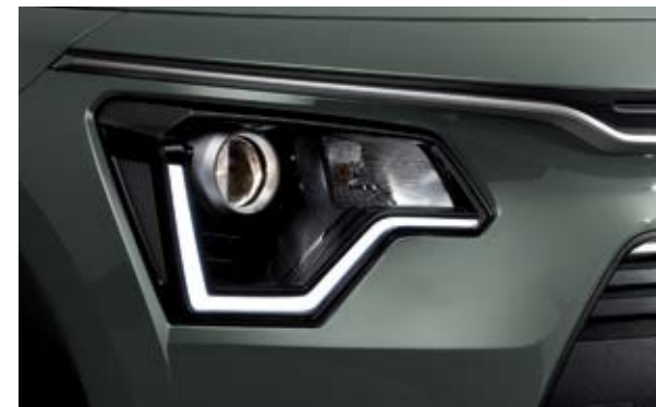
פנסים ראשיים עם תאורת נסיעה ביום LED