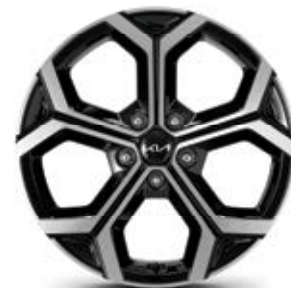
חישוקי סגסוגת 18 אינץ' *בדגם פלאג אין