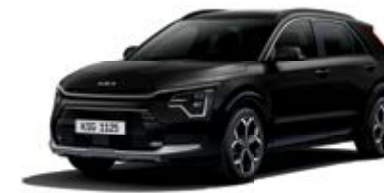
Aurora Black Pearl (ABP)