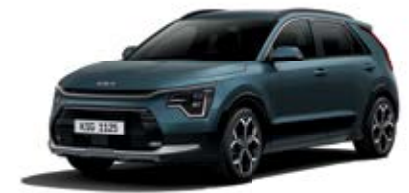
Mineral Blue (M4B)