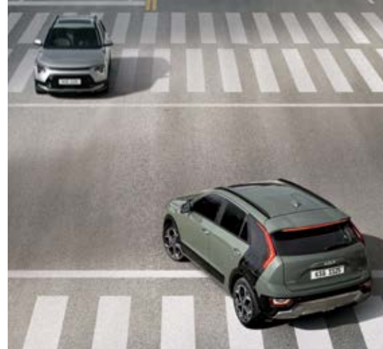
מערכת לסיוע במניעת התנגשות קדמית (FCA) באמצעות מצלמה קדמית ורדאר קדמי, מסוגלת מערכת FCA לזהות כלי רכב, הולך רגל או רוכב אופניים שנמצא לפניך, להזהיר אותך, ואפילו לבלום באופן אוטומטי. היא תבלום גם באופן אוטומטי אם היא מזהה סכנה של רכב שמתקרב מימין או משמאל בצומת שפניך.