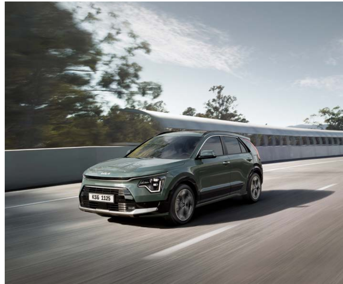
סיוע לשמירה על מרכז הנתיב (LFA) כדי לסייע לך לשמור את הרכב במרכז הנתיב במהלך הנסיעה, משתמשת מערכת LFA במצלמה הקדמית כדי לסייע להנחות את ההיגוי, בהתבסס על סימוני הנתיב ועל המכונית שלפניך.