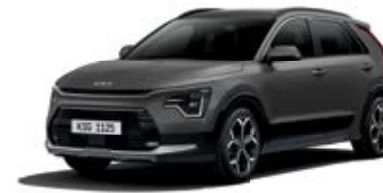
Interstellar Gray (AGT)