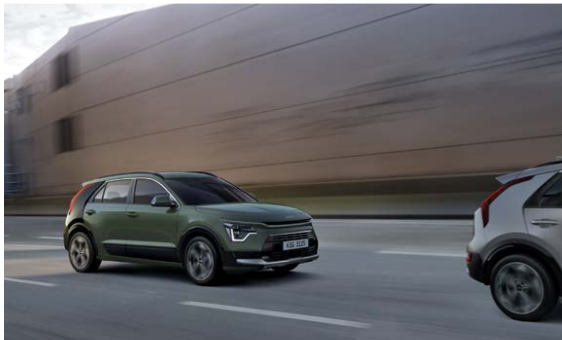
בקרת שיוט חכמה (SCC) בקרת השיוט החכמה מסייעת לשמור על המרחק מהרכב שמלפנים ועל המהירות שהוגדרה על ידי הנהג. הנירו עוצר באופן אוטומטי אם הרכב שלפניו מגיע למצב של עצירה מוחלטת, וממשיך בנסיעה באופן אוטומטי אם הרכב שמלפנים מאיץ שוב בתוך פרק זמן מוגדר.