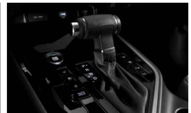
תיבת הילוכים אוטומטית