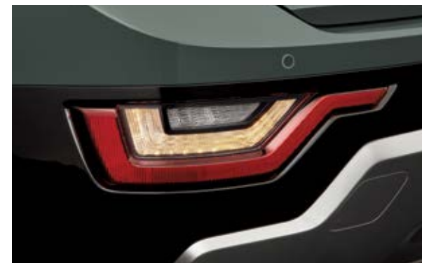
מהבהבי פנייה LED