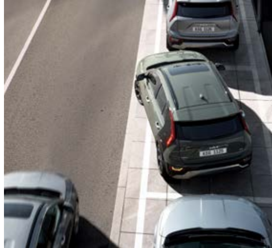
מערכת לסיוע במניעת התנגשות בשטח מת (BCA) כשאתה מפעיל את מהבהבי הפנייה כדי לעבור נתיב, מערכת BCA מזהירה אותך אם קיימת סכנה של התנגשות עם רכב שמגיע מאחור. אם בעת יציאה מחניה במקביל קיימת סכנה של התנגשות עם רכב שנמצא מאחור, היא מסייעת באופן אוטומטי באמצעות בלימת חירום.

צפייה, חישה והתערבות בכל פעם שאתה זקוק לסיוע: מערכת DRIVE WISE של קיה מיישמת את הטכנולוגיות המתקדמות ביותר בתחום מערכות סיוע מתקדמות לנהג (ADAS) כדי לעזור לך לשמור על ערנות, בטיחות ושליטה. היא מבטיחה בטיחות אולטימטיבית ליושבי הרכב ולהולכי הרגל.