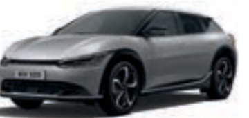
Iron Gray (KLG)