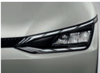
פנסים ראשיים MFR LED (בדגם Premium)