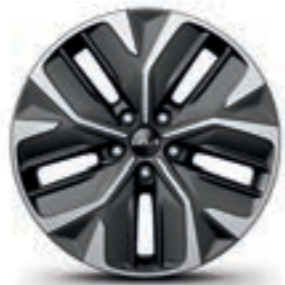
חישוקי סגסוגת 19 אינץ' (Premium)