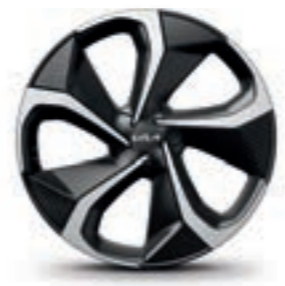
חישוקי סגסוגת 20 אינץ' (GT-line)