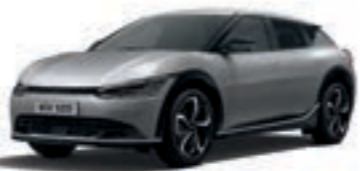
Moonscape (KLM)* צבע בתוספת תשלום*