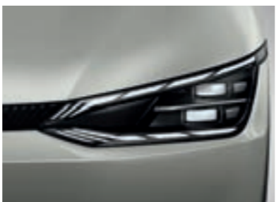
פנסים ראשיים IFS LED (בדגם GT-Line)