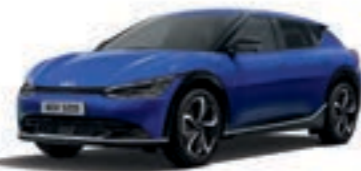
Yacht Blue (DU3)