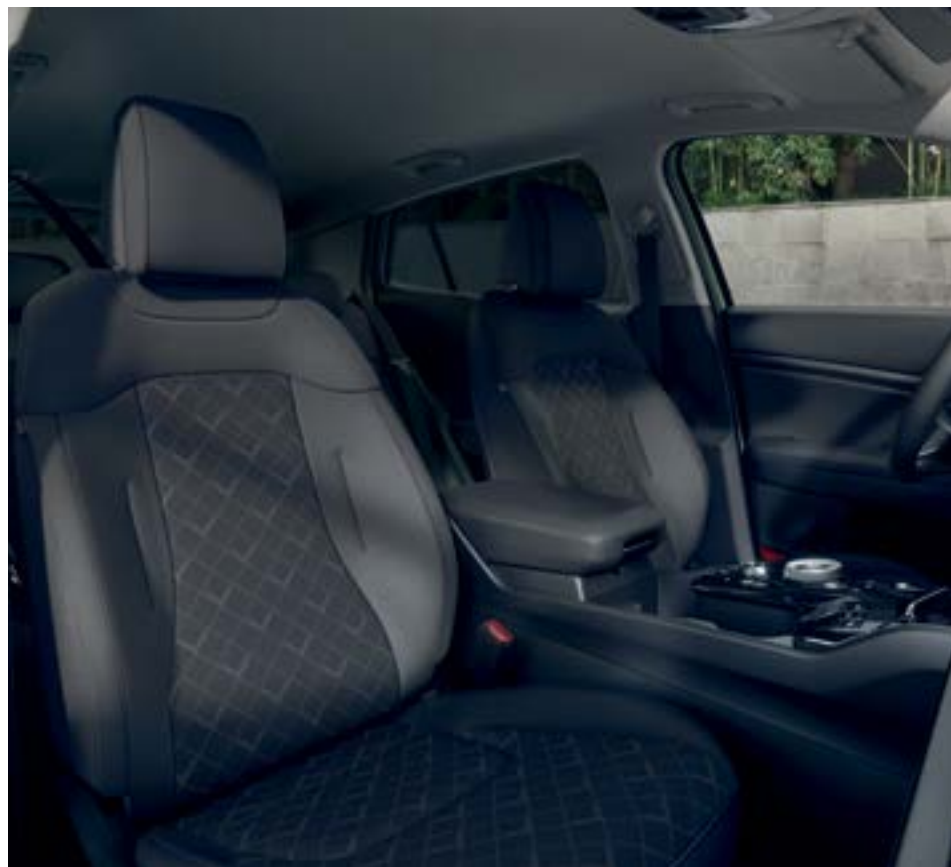
TOP+URBAN – בד שחור טנדרטי. רמת הגימור LX מגיעה כסטנדרט עם מושבים וכריות צד מצופים בבד שחור עם תפרים שחורים, וריפוד תקרה אפור.