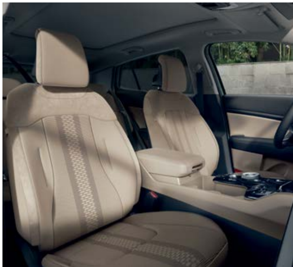
PREMIUM – עור אייס קפה. מושבי עור בצבע קפה מיוחד מוסיפים מגע של סגנון. כולל גם דגשי זמש בחלק העליון של המושבים ובצידי משענות הראש. להשלמת החבילה, החיפויים העליונים בדלתות הם רכים למגע ולוחות החיפוי המרכזיים ומשענות היד בדלתות מצופים בעור מלאכותי בצבע קפה. מגיע עם ריפוד תקרה אפור.